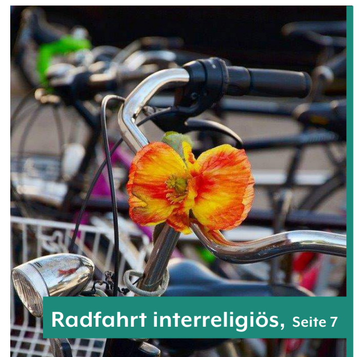
Radfahrt interreligiös, Seite 7