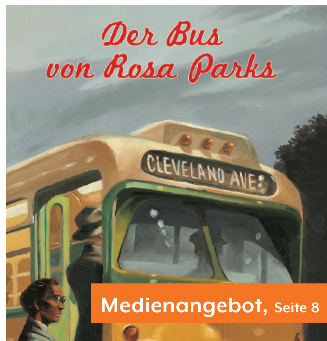
Medienangebot, Seite 8