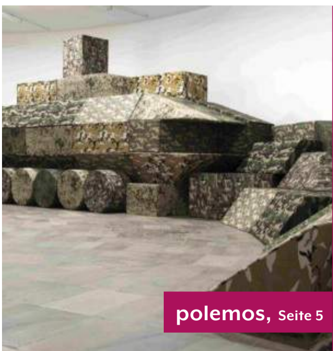
polemos, Seite 5